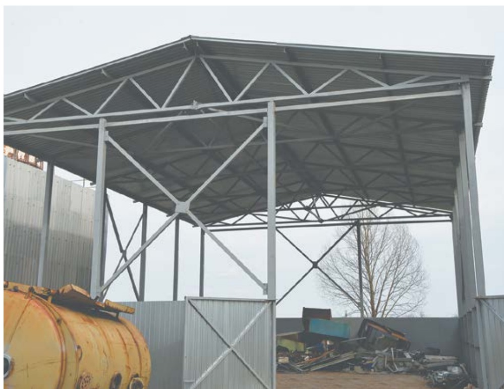
Навес защищает металлические отходы от осадков.

Сейчас таким же образом благоустраивают места хранения металлической стружки за корпусом