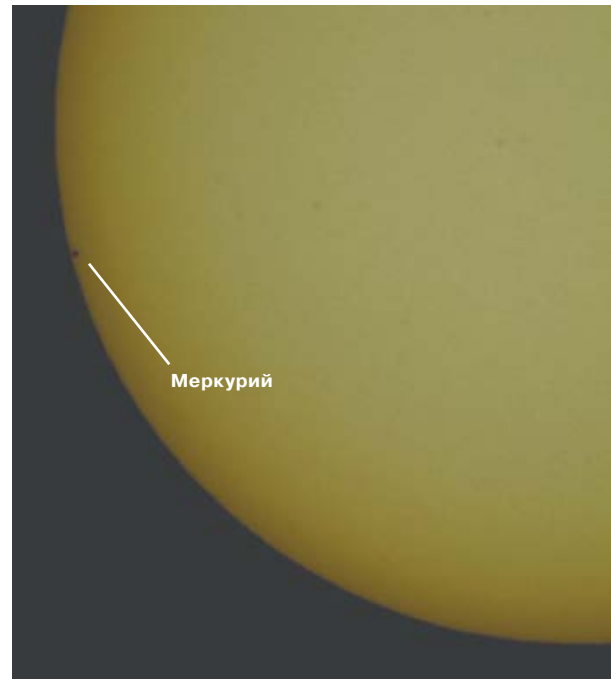
Прохождение Меркурия по диску Солнца.

Екатерина ЯДРОВА